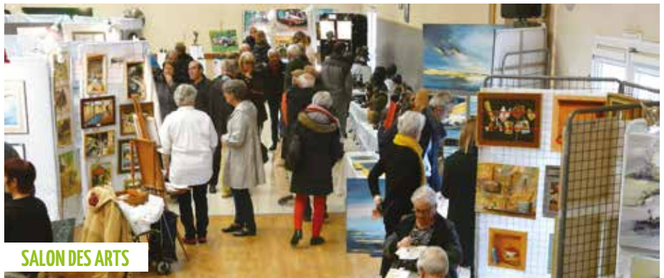
SALON DES ARTS