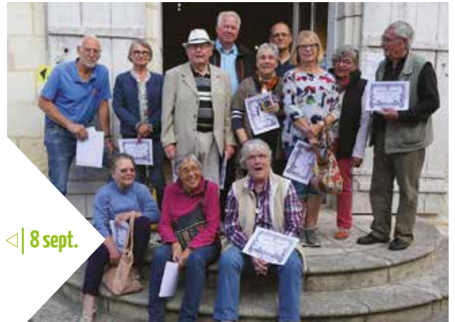
8 sept. <| Journée des peintres