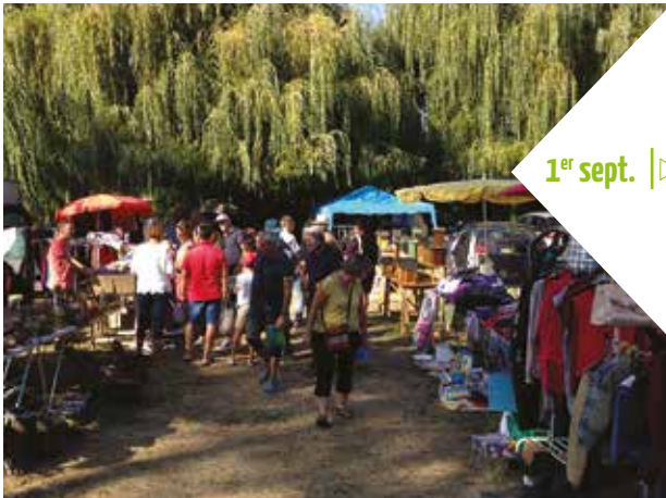
1 er sept. |> Vide-Genier Bords du Cher