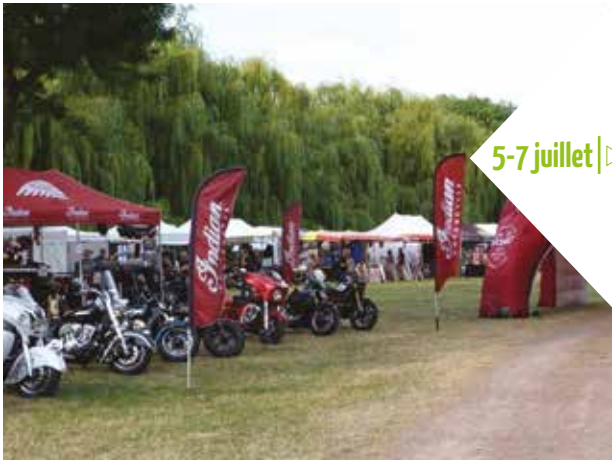
5-7 juillet |> Concentration Moto Bords du Cher