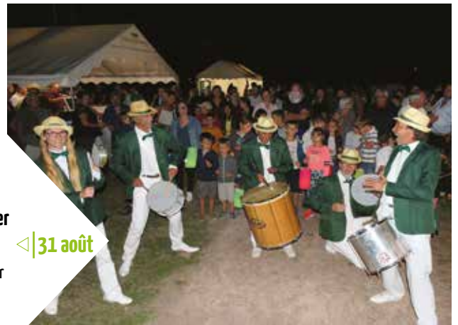
31 août <| Bords du Cher en Fête Bords du Cher