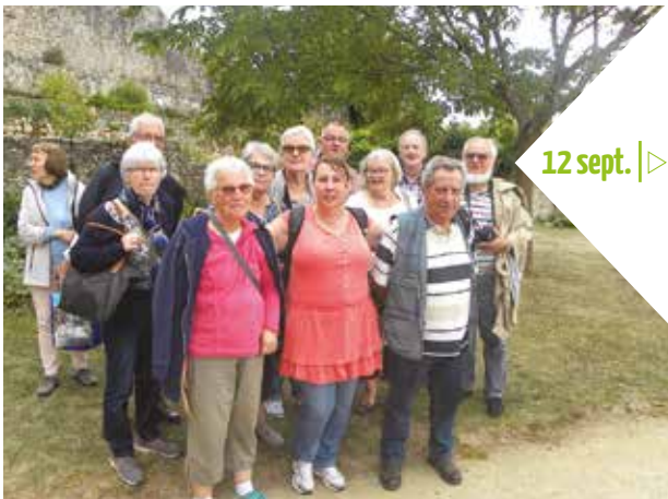
12 sept. |> Sortie du CCAS à Sainte-Suzanne