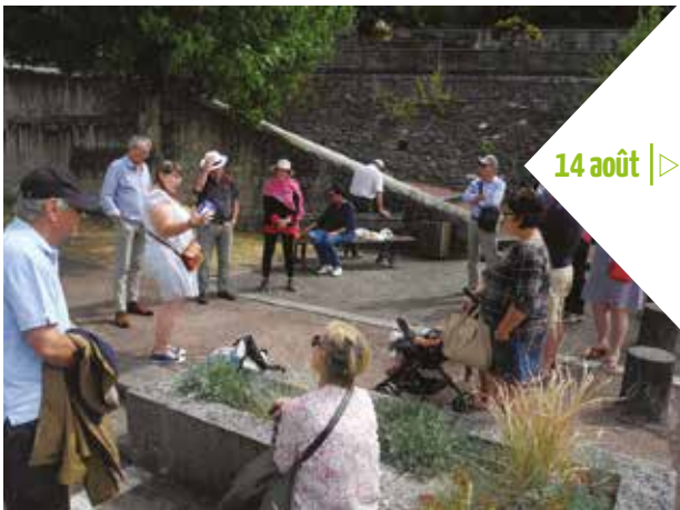
14 août |> Visite à déguster