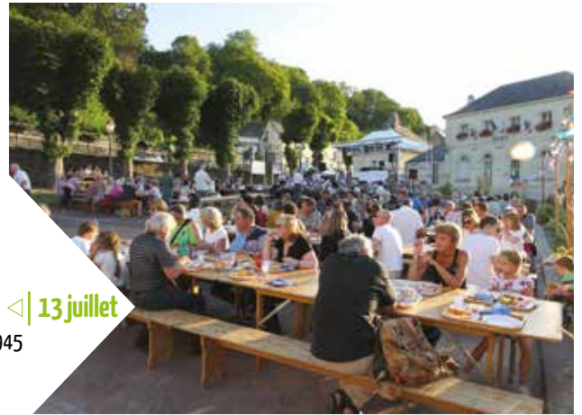
13 juillet <| Festivités du 14 juillet Place du 8 mai 1945