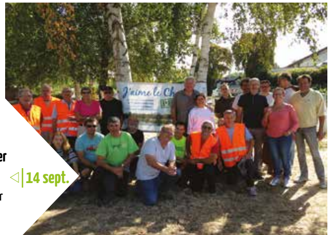
14 sept. <| J'aime le Cher Propre Bords du Cher